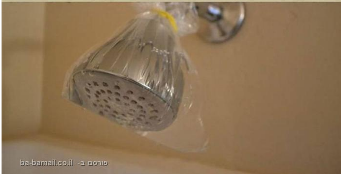
פורום ב- ba-bamail.co.il

להסרת אבנית מראש הדוש במקלחת, קשרו שקית ניילון עם חומץ סביב הראש והשאירו אותה ללילה. זה יסיר את כל האבנית ללא מאמץ.