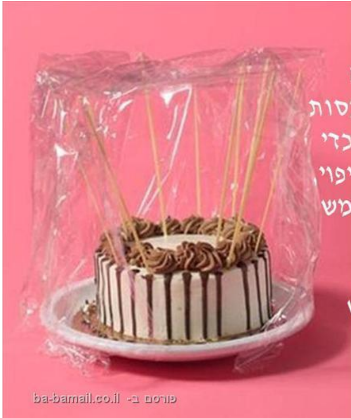
פורום ב- ba-bamail.co.il

על מנת שעוגה לא תתייבש, מומלץ לכסות אותה בניילון. אך כדי לא להרוס את הציפוי, אתם יכולים להשתמש בספגטי יבש או שיפודים ארוכים, בשביל ליצור אפקט של גובה.